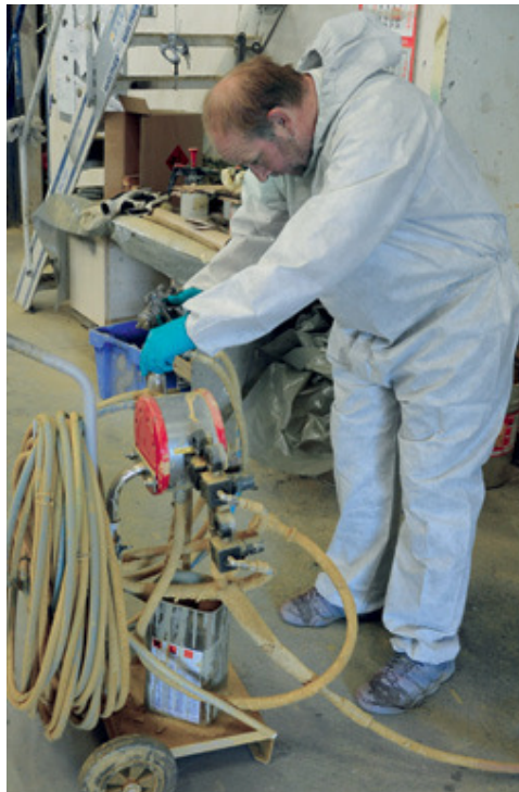
Die Doppelmembranpumpe sorgt dafür, dass zwei Lackierer gleichzeitig auch große Flächen lackieren können.

Die Lackierung des Unterbaus mit Grundierung und