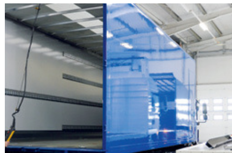
Die Lackierung von Nutzfahrzeugen orientiert sich in Bezug auf die Optik immer stärker an der Automobillackierung, hin zu hochglänzenden Oberflächen.