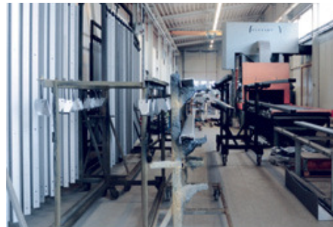
In der hauseigenen Strahlanlage werden die Stahlteile vor dem Lackieren gestrahlt.

Die Lackierung trocknet bei 80 °C direkt in den beiden Lackierkabinen. Aktuell können Zu- und Abluftführung je nach Bedarf geregelt werden, um so